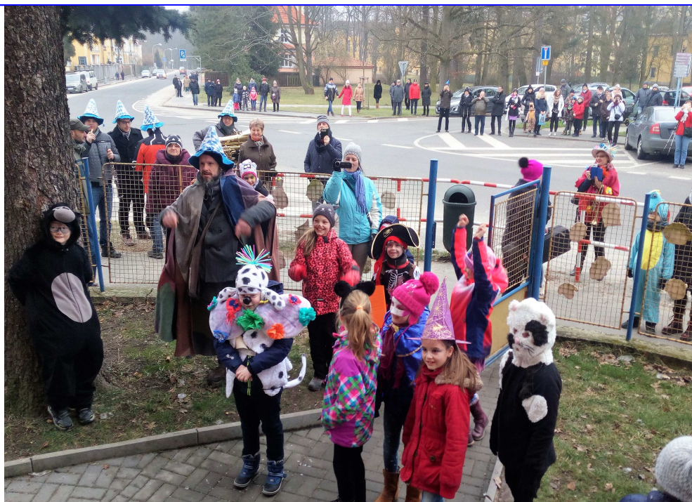
Masopustní průvod organizovala už tradičně naše škola... více na další straně