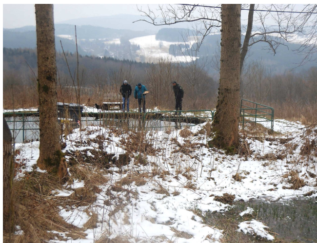
Míst, která jsou ještě nenarušená lidskou činností u nás už mnoho není...

Dnes mám takový pocit, že snad mladší děti většinou ani neví, kde se vlastně berou vejce nebo mlé-