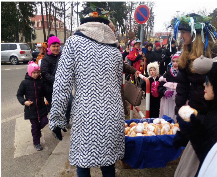
Koblihy lákaly malé i velké.