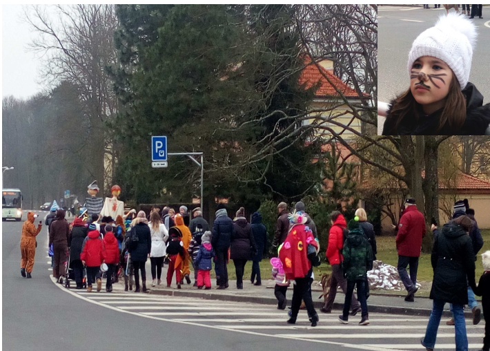
Průvod se vydal od školy směrem k radnici.