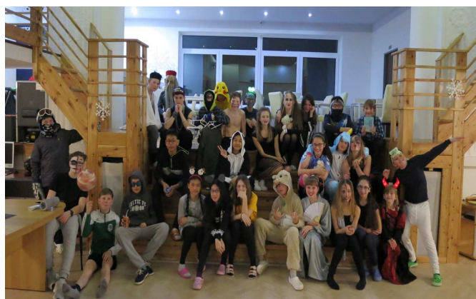
Zde je naše třída při „maškaráku“.