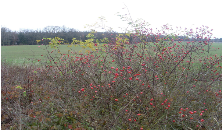
Šípky jsou květy podzimu. Nejsou ty červené ozdůbky připomínající kapky krve na holých větvích kouzelné?