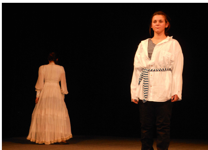
...Boy se bude ženit... Co na to Coco?